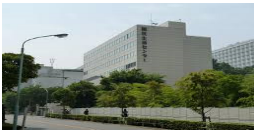
【国民生活センター・東京事務所】外観