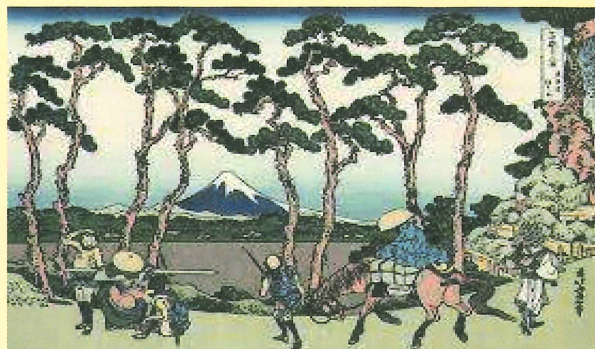
葛飾北斎 富嶽三十六景 東海道程ヶ谷

門前に置かれた2つの大きな鉄釜や仏足石が出迎える香象院、北条政子が化粧に使った井戸、十返舎一九の弟子五返舎半九が眠る福聚寺、縄文時代から人が住んでいた瀬戸ヶ谷地区にある瀬戸ヶ谷八幡社などを経て富士山を遠望しながら権太坂を上ります。坂を上ると今も昔も美味しい和菓子が待っています。