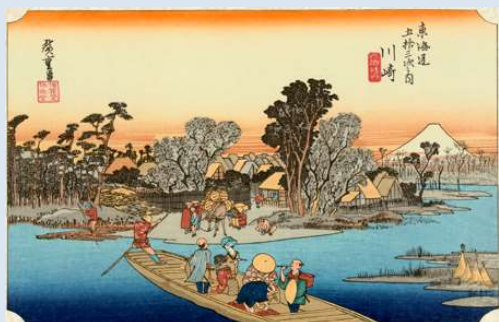
広重「東海道五十三次 川崎 六郷渡舟」

六郷川を渡り川崎宿に入ると、弘法大師への道と刻まれた道標があり、東海道から別れ、川崎大師に向かう大師道があります。