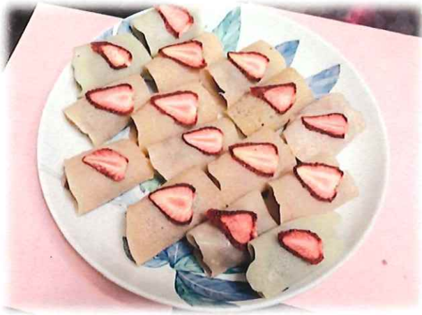
桜餅の苺バージョン