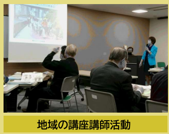
地域の講座講師活動