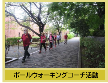
ポールウォーキングコーチ活動