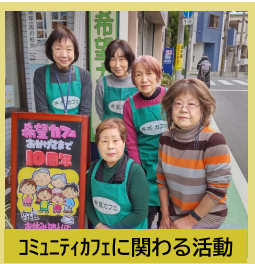
コミュニケーションに関わる活動