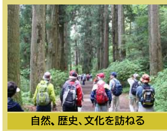
自然、歴史、文化を訪ねる

このほか 各種サークル活動や 地域で情報交換定例会など、 幅広く活動しています。