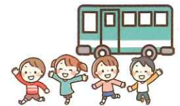
レクリエーション費用 (日帰りバス旅行等)