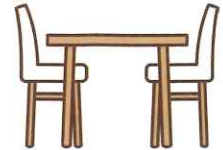
ダイニングテーブル、 椅子セット