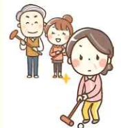
スポーツ大会 開催費用