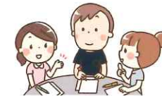
セミナー開催費用