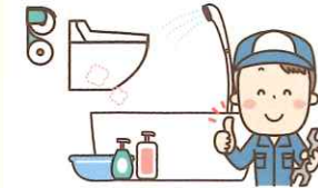
トイレや浴室の 改修工事