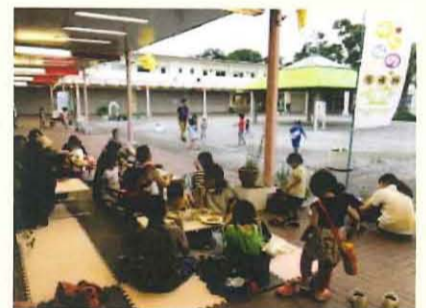
子どもたちは外で 食べて遊びます★