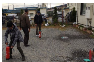
△水消火器を使った消火訓練