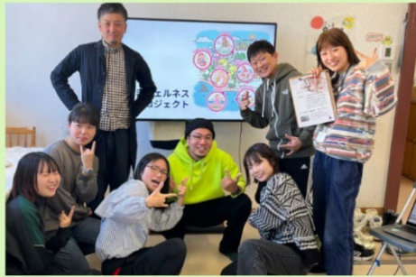
△ おしゃべりばー 第1回~4回 (詳細はP6)