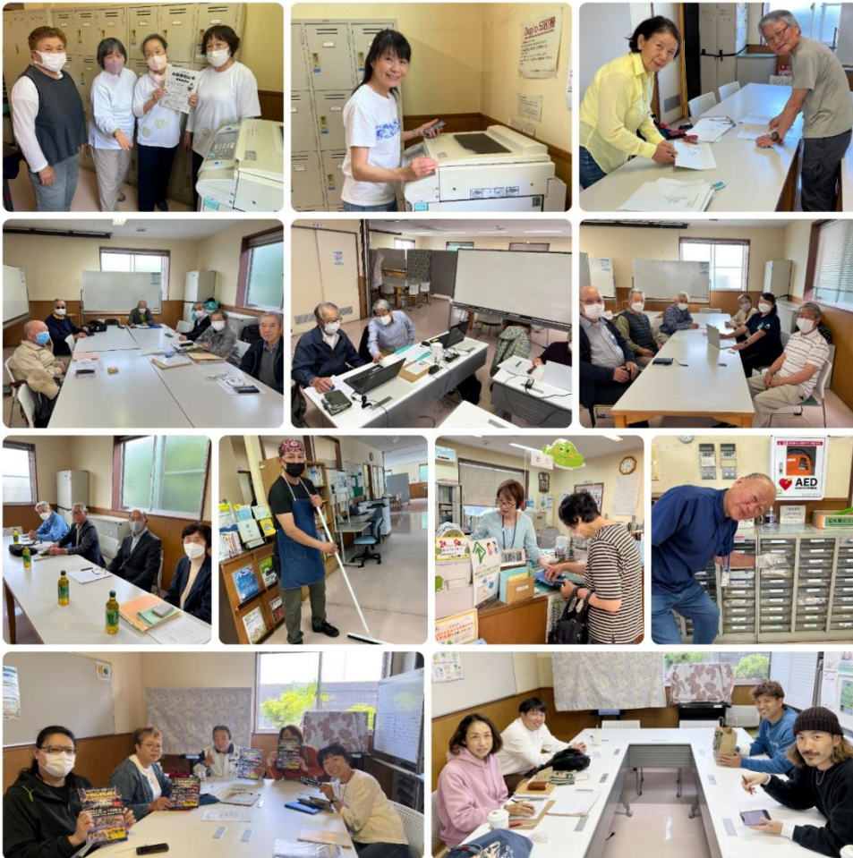
△マスクがあってもなくても笑顔が増え、活気づいてきました！