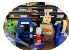
貸出文房具の一部