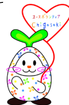
イメージキャラクター ドリーミー