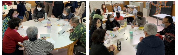
▲第5回は申し込んだ方が全員参加！リアルな対話や交流を求める人たちの熱気であふれました