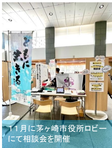
11月に茅ヶ崎市役所ロビーにて相談会を開催

自分の中にある考えや感情を自分の言葉にして伝えること、それが温かく受け止められること——。こんなあたりまえのことが、困難な時代がありました。 そして今でも、それが難しい人たちがいます。