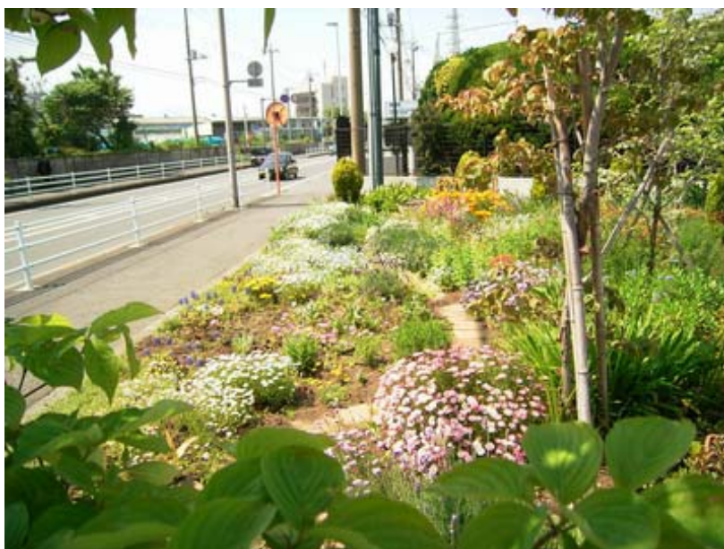
サポートセンター入口の花々が皆様をお迎えます

2007 年秋号 Vol.18 http://business2.plala.or.jp/support/