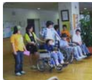
福祉施設でのボランティア (NPO 法人かでの湘南イートアッププロジェクト)

誰かの役に立ちたい、友だちと一緒に体験したい、将来の職業選択を考えながら取り組みたいなど、さまざまな動機から、今年も中学生から大学生までの 90 人がボランティア体験を行いました。これからも、若い感性とエネルギーにあふれたボランティア活動が地域に広がって行くことを期待しています。夏休み以外でもボランティア体験したい方は、市民活動サポートセンターにご相談ください。