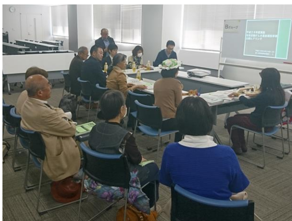
市民活動げんき基金補助事業 公開ヒアリングの様子