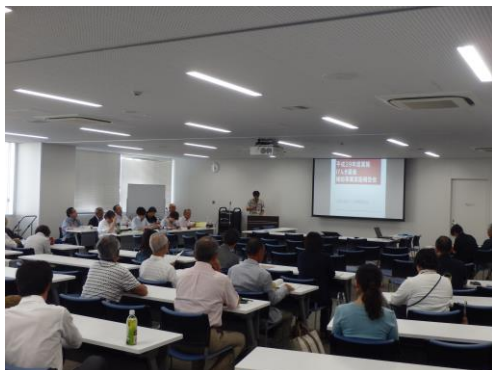
市民活動げんき基金補助事業 実施報告会の様子